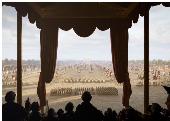
14 juillet 1790 – La Fête de la Fédération, premier « 14 Juillet ».