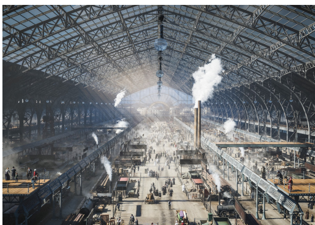
1889 – La Galerie des Machines, plus grande structure métallique d'Europe.