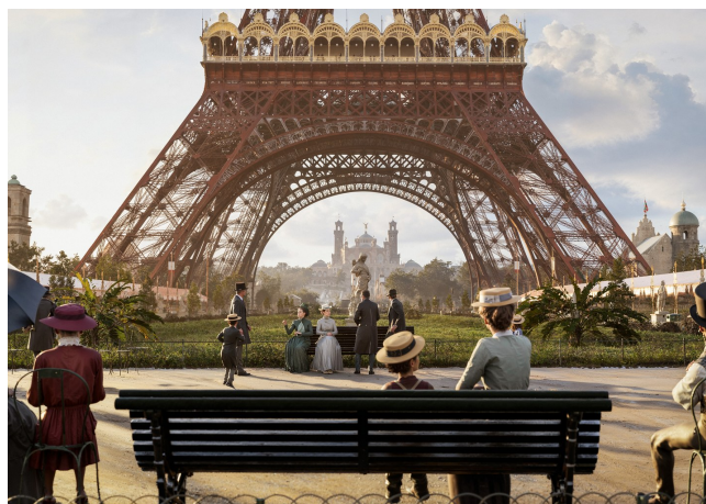
1889 – L'Exposition universelle et ses palais éphémères.