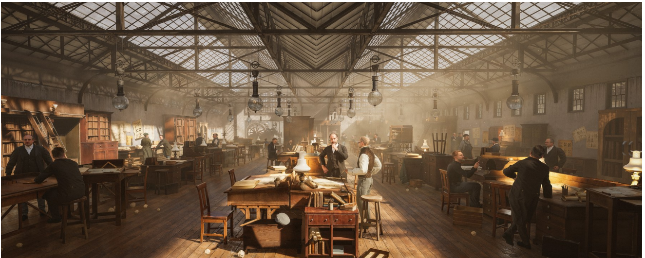
Les ateliers d'Eiffel à Levallois-Perret, reconstitués en 3D d'après les archives.

Des révélations méconnues. L'expérience s'attache aux histoires que les Parisiens eux-mêmes ignorent : la Tour n'est pas l'idée d'Eiffel seul ; la Statue de la Liberté fut assemblée en plein Paris ; une « Colonne Soleil » de 350 mètres a failli prendre sa place ; c'est la science qui l'a sauvée du démontage.