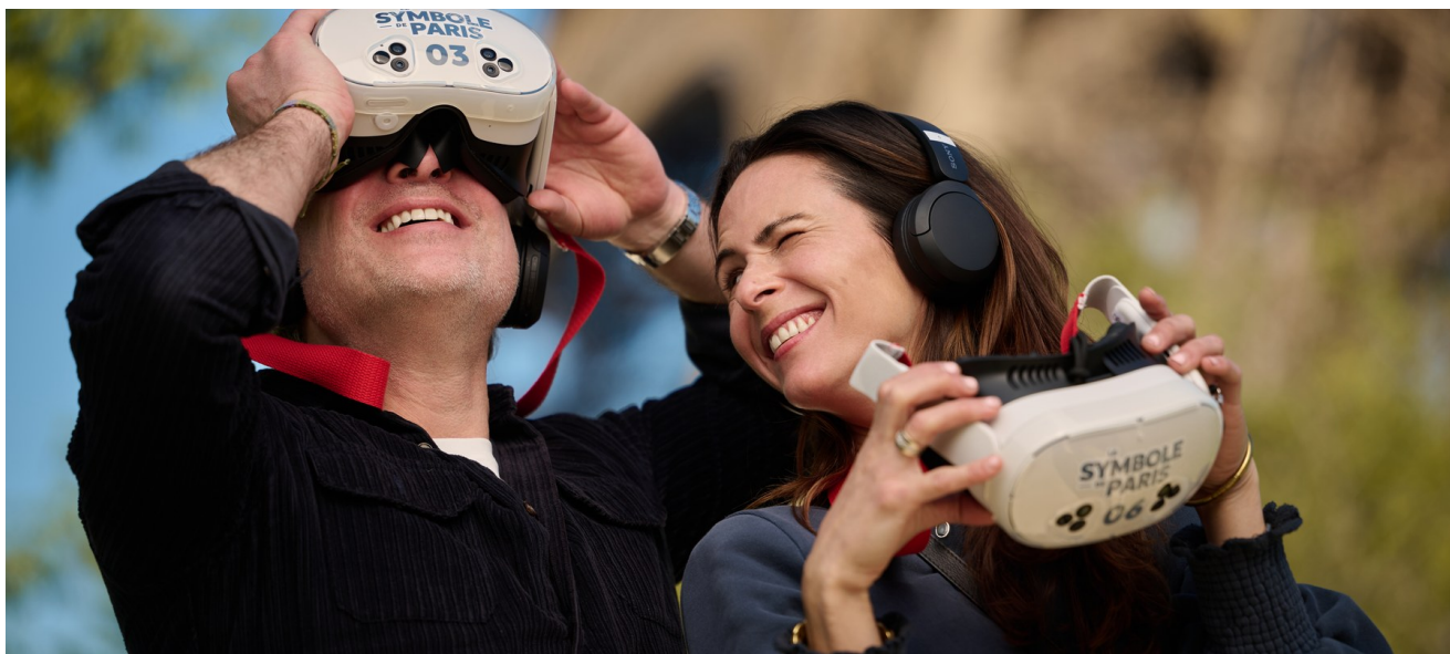
Munis d'un casque de réalité virtuelle et d'un casque audio, les visiteurs voyagent dans le temps au pied de la Tour Eiffel.