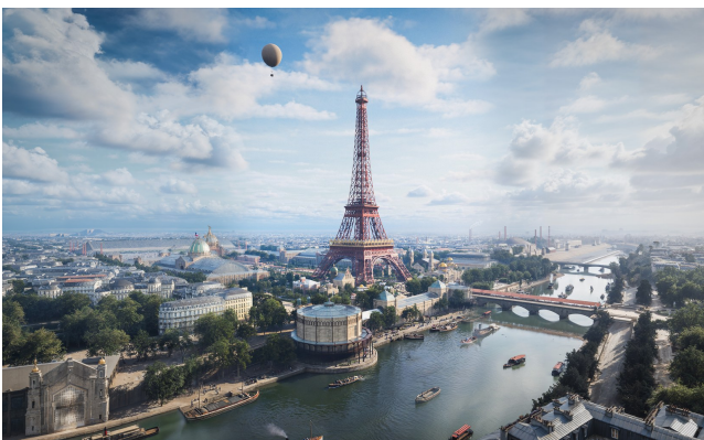
L'Exposition universelle de 1889, avec la Tour Eiffel alors peinte en rouge. Reconstitution Timescope.

ADRIEN SADAKA, CO-FONDATEUR DE TIMESCOPE