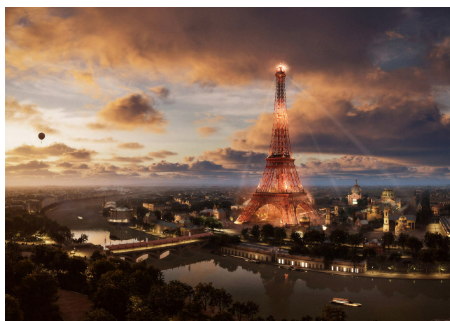
La Tour illuminée : « un véritable embrasement ». Reconstitutions 3D Timescope.