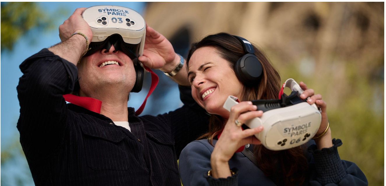
Le Symbole de Paris, deuxième promenade immersive de Timescope à Paris.