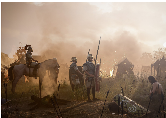
-52 av. J.-C. – La défaite des Parisii face aux légions romaines.