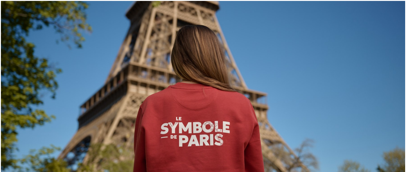
Le parcours est encadré par des guides Timescope, du départ rue Dupont des Loges jusqu'au retour.

À chaque point d'arrêt, le casque bascule : le décor réel s'efface et le site renaît à une autre époque, reconstitué en 3D à 360°. Entre les scènes, la voix off et la musique accompagnent la marche, tandis qu'un compteur d'années matérialise chaque saut temporel. Certaines étapes font surgir, en réalité augmentée, monuments disparus et esquisses d'architectes dans le paysage d'aujourd'hui.