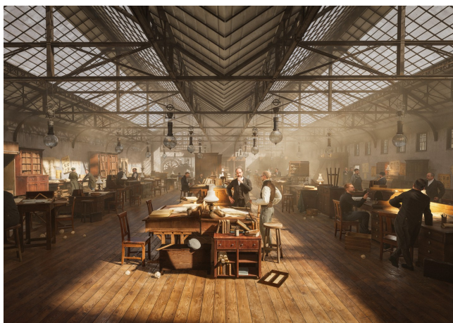
1884 – Les ateliers d'Eiffel à Levallois-Perret, où la Tour a été conçue.